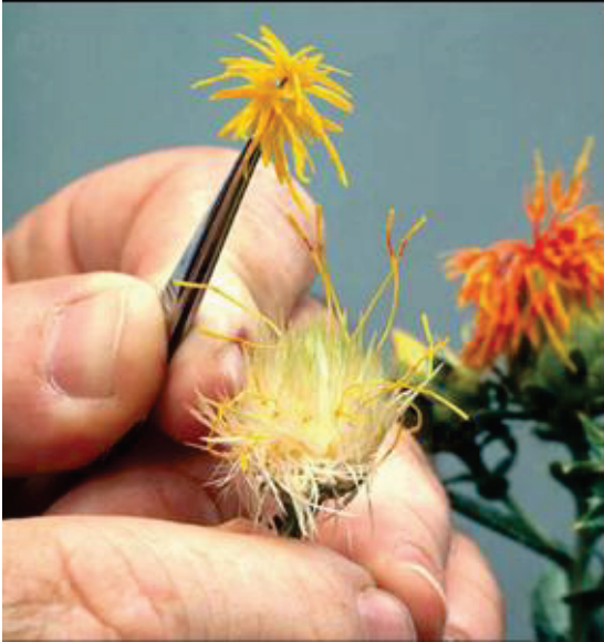
Şekil 5. Tozlanma (Volmann and Rajcan, 2009)

Tozlanma: Hem tarlada hem serada erkek ebeveyn olacak bitkilerin tablaları, kullanımından bir gün önceden belirlenir. Tüm uzamış olan çiçekler, tabladan kesilerek uzaklaştırılır. Çünkü bunlara yabancı polen bulaşmış olabilir. Daha sonra bunlarda kapatılır. Ertesi sabah anterlerini braktenin dışına çıkarmış olan tablalar melezlemede kullanılır. Tozlanma, getirilen erkek ebeveynin anterlerinin dişi bitkinin stigmalarına sürülmesiyle yapılır (Şekil 5). Bitkinin üzerindeki ana tabla polen üretimi içinde en uygun tabladır. Polenler görülür görülmez tozlanma başlar ve günün sonuna kadar polen üretimi devam ettikçe de devam eder. Erkenden tozlanmayı yapabilmek için erkek bitki olarak seçilen bitkilerin tablaları alınmalı, sıcak ve ışıklı bir odada tutulmalıdır. Polenler fırçalarla stigmanın üzerine taşınabilir.