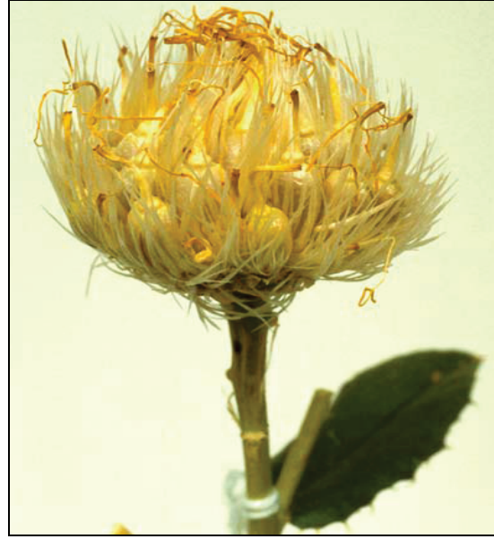
Şekil 6. Melez tohumlar (Volmann and Rajcan, 2009)

korunmalıdır. Islah ve genetik çalışmalar için gerekli olan kendilenmiş tohumları elde etmek için, bitkinin tablaları kağıt poşetlerle kapatılır. Bu işte kullanılacak kağıtların en önemli özelliği nemi içeride tutmayan ve böcek girişine izin vermeyen yapıda olmasıdır (Knowles 1982). Başarılı melezlemeden birkaç gün sonra tohum oluşacaktır (Şekil 6). Kapatılmış tabla içinde yüksek nem birikmesini önlemek için poşet kesilebilir veya tamamen ortadan kaldırılabilir (Volmann and Rajcan, 2009). Tohumlar olgunlaşır olgunlaşmaz hasat edilebilirler.