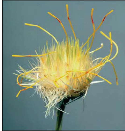
Şekil 4. Tozlanmaya hazır, uzamış dişi çiçekler (Volmann and Rajcan, 2009)