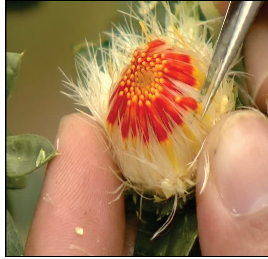
Şekil 3. Emaskülasyon (b)