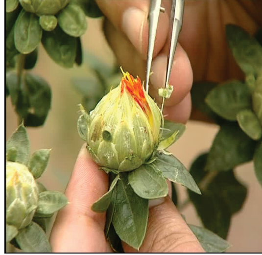
Şekil 2. Emaskülasyon (a)

Tablada istenen sayıda çiçekte kastrasyon yapıldıktan sonra tablanın merkezine doğru kalan çiçeklerin tümü alınarak atılmalıdır. Kastrasyonda olgunlaşmamış çiçek tomurcukları üzerinde çalışılmamalıdır. Çünkü bunların kastrasyonunda stilin zarar görme ihtimali yüksektir. Çalışma açıkta yapılıyorsa kastrasyondan sonra tablalar kapatılmalı ve gerekli bilgilerin yazıldığı etiketler bitkiye takılmalıdır. Kastrasyon esnasında tablaya en az düzeyde zarar vererek sadece çiçek kısımları alınırsa daha çok tohumun tuttuğu gözlenmiştir.